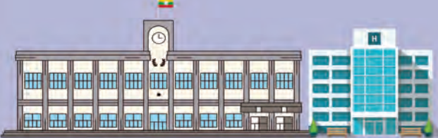
သက်ဆိုင်ရာအဖွဲ့အစည်းများ (ဥပမာ - တက္ကသိုလ်များ၊ ဆေးရုံများ)

ဆန္ဒမဲပေးရမည့်ရက်များ - ၂၀၂၀ ပြည့်နှစ်၊ အောက်တိုဘာလ (၈) ရက်မှာ (၂၁) ရက်အတွင်း။ (သက်ဆိုင်ရာဌာနများက သတ်မှတ်သည့်နေ့) ဆန္ဒပြုခြင်း - ဘောလိပ်ဖြင့် အမှန်ခြစ်ဆန္ဒပြုခြင်း ဆန္ဒမဲပေးရမည့်နေရာ - အဖွဲ့အစည်းများ (တက္ကသိုလ်များ၊ ဆေးရုံများ စသည်ဖြင့်)