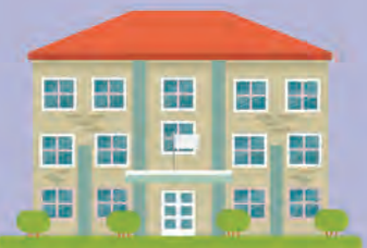
ပြည်ပနိုင်ငံများရှိမြန်မာသံရုံးများ

ဆန္ဒမဲပေးရမည့်ရက်များ - ၂၀၂၀ ပြည့်နှစ်၊ စက်တင်ဘာလ (၂၃)ရက်မှ အောက်တိုဘာလ (၂၈) ရက်အတွင်း။ (သံရုံးများကသတ်မှတ်သည့်နေ့) ဆန္ဒပြုခြင်း - ဘောလိပ်ဖြင့် အမှန်ခြစ်ဆန္ဒပြုခြင်း ဆန္ဒမဲပေးရမည့်နေရာ - ပြည်ပနိုင်ငံများရှိ မြန်မာသံရုံးများ