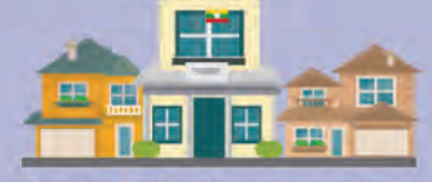
သက်ဆိုင်ရာ ရပ်ကွက် / ကျေးရွာအုပ်စု ရွေးကောက်ပွဲကော်မရှင်အဖွဲ့ခွဲများနှင့် တစ်အိမ်တက်ဆင်းကြိုတင်ဆန္ဒမဲကောက်ယူခြင်း

ဆန္ဒမဲပေးရမည့်ရက် - ၂၀၂၀ ပြည့်နှစ် နိုဝင်ဘာလ (၆)ရက်နှင့် (၇)ရက် အထက်တွင်ဖော်ပြထားသော မဲဆန္ဒရှင်များမှ အမှတ်(၉)တွင် ဖော်ပြထားသူများသည် ရွေးကောက်ပွဲနေ့မတိုင်မီ (၁၀)ရက် အတွင်းတွင် ကြိုတင်ဆန္ဒမဲပေးနိုင်သည်။ ကြိုတင်ဆန္ဒမဲပေးရမည့် ရက်များကို ပြည်ထောင်စုရွေးကောက်ပွဲကော်မရှင်က ကြေညာမည်ဖြစ်သည်။ ဆန္ဒပြုခြင်း - တံဆိပ်တုံးဖြင့် ဆန္ဒမဲပေးရမည့်နေရာ - သက်ဆိုင်ရာ ရပ်ကွက် / ကျေးရွာအုပ်စု ရွေးကောက်ပွဲကော်မရှင်အဖွဲ့ခွဲများနှင့် တစ်အိမ်တက်ဆင်းကြိုတင် ဆန္ဒမဲကောက်ယူခြင်း